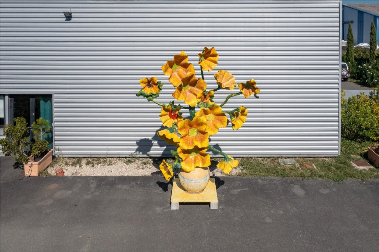
↑↓ Septembre, sud ouest, 15 h, vue au drone