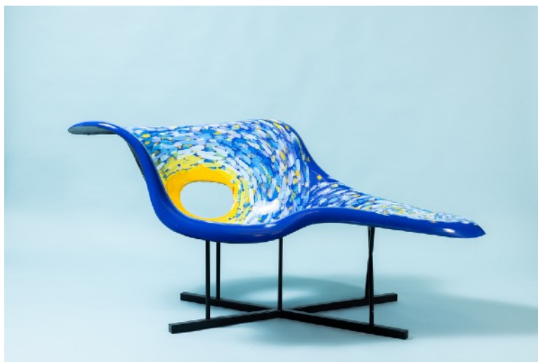
« Eames – La chaise 005 », moulage en résine polyester armée de fibre de verre d'une chaise Eames, application des couleurs dans la masse inspirée du tableau de Van Gogh « La nuit étoilée », 160 × 78 × 85 cm, 2022

Bruno Bossut est un artiste fédérateur. Il se sert de la citation (d'objets design) dans son travail pour emporter avec lui le spectateur qui va parvenir à identifier la référence (comme ici pour les tournesols). Loin d'être nostalgique, il s'appuie sur un passé pour l'enrichir au présent. Lorsqu'il travaille à partir de pièces de design vintage, il s'agit