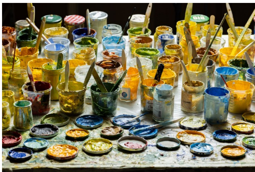
Cuvettes contenant les couleurs gelcoat des tournesols, palette de l'artiste

Transport : dans un camion de 3,5 tonnes ou sur un plateau-remorque tracté par une voiture