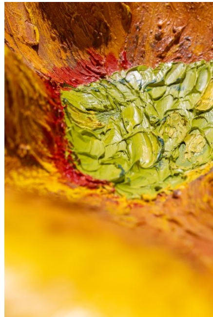
Détail de la touche empâtée de l'artiste sur l'un des tournesols