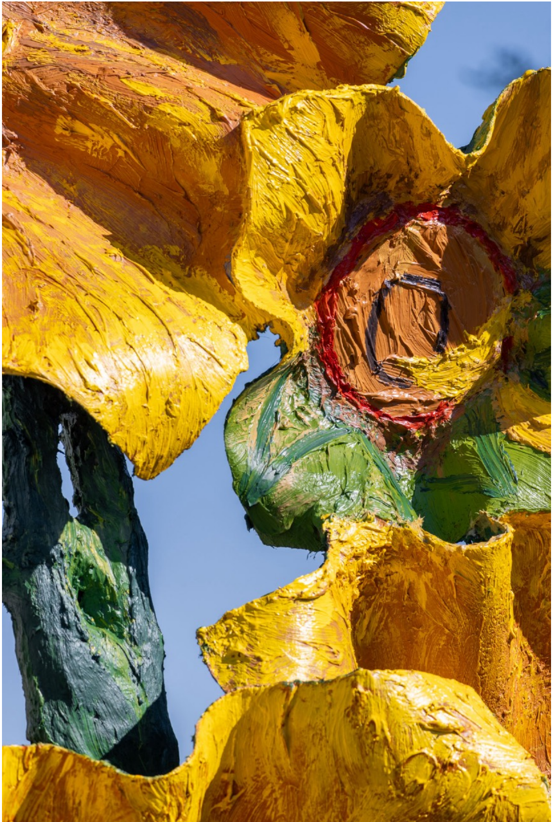
Septembre, sud est , 11h