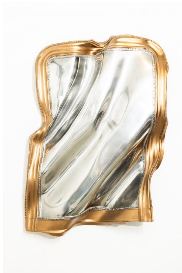
« Grand miroir », moulage en silicone d'un miroir, déformation du moule et tirage unique en résine polyester armée de fibre de verre, dorure, peinture effet chrome, 110 x 140 x 25 cm, 2022