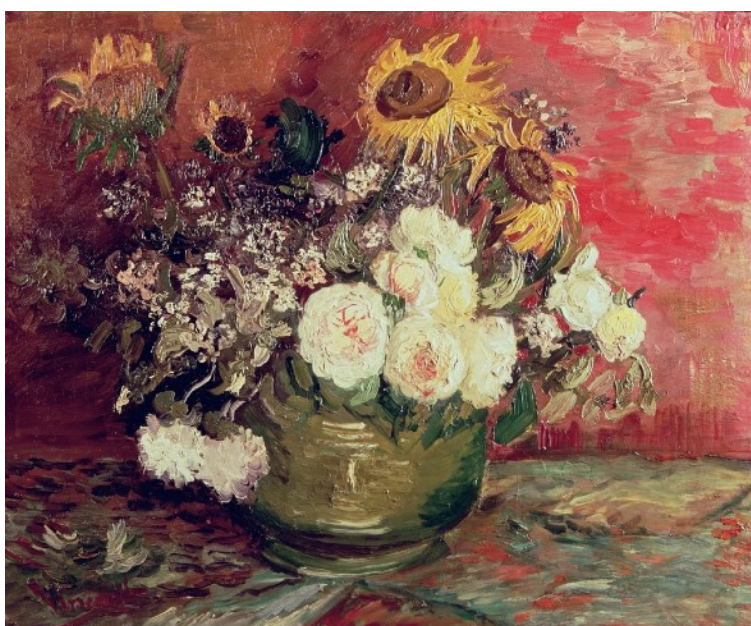
« Tournesols roses et autres fleurs dans un bol », Vincent Van Gogh, 1886

ses flancs cernés de marron donnant l'illusion d'une platitude ; de même, le dos de la pièce est laissé brut afin de renforcer le sens de lecture. Pour cette raison, Bruno Bossut affirme avoir créé avant tout une peinture monumentale adoptant des atours sculpturaux pouvant s'apparenter, par certains aspects, au bas-relief.