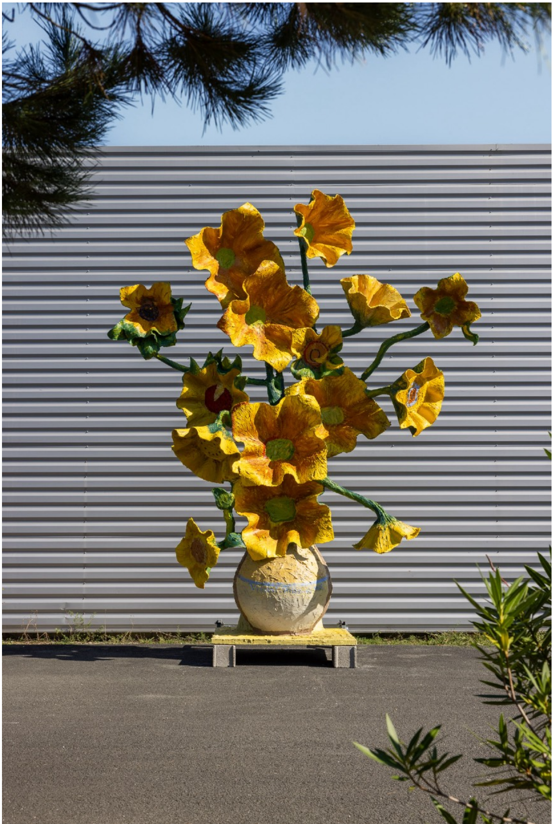
Septembre, sud ouest, 12 h