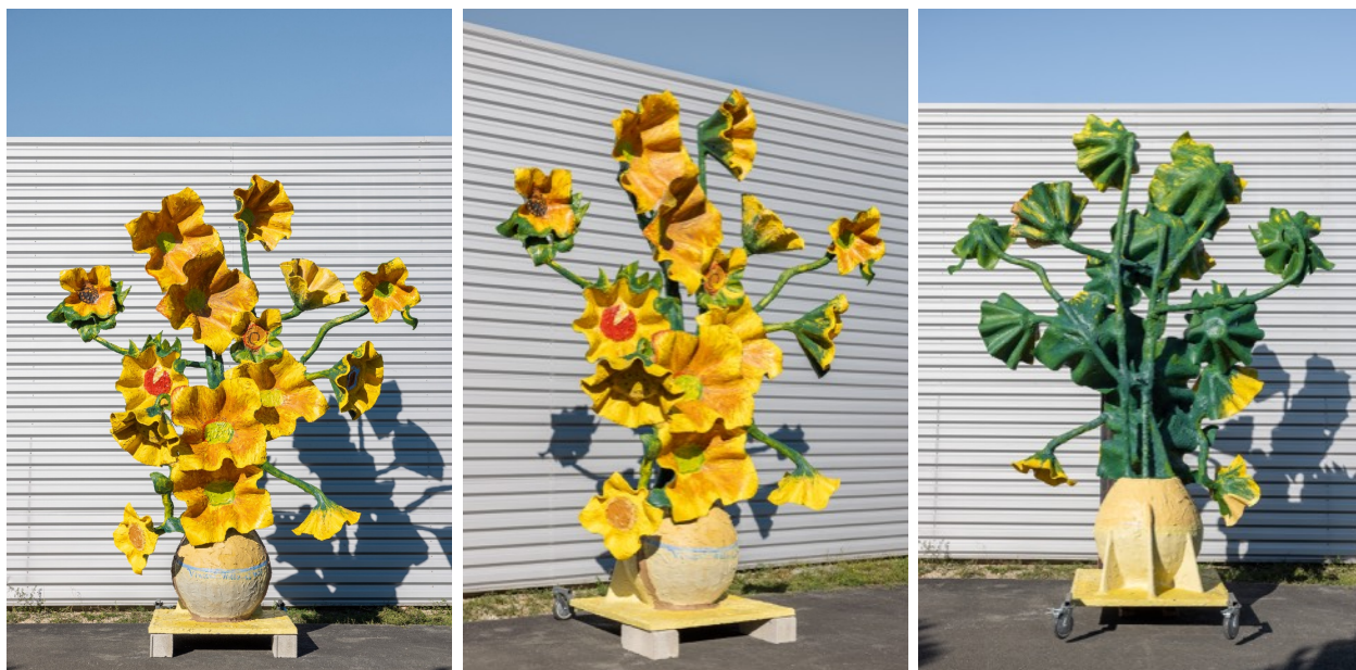
Vues de face, de biais et de dos, ce dernier est laissé brut pour affirmer la lecture frontale de l'œuvre