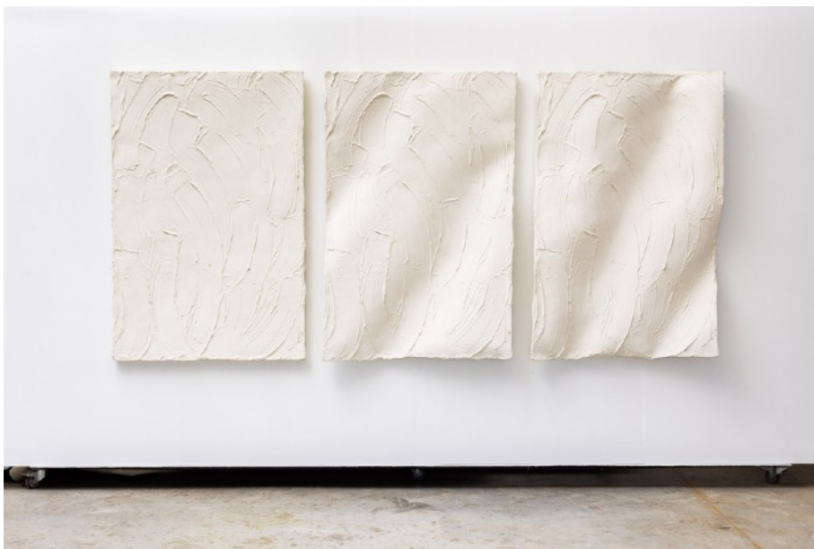
« Au gré du vent, triptyque », moulage silicone, déformation du moule et tirages en résine polyester armée de fibre de verre, couleur dans la masse 300 × 140 × 20 cm, 2018