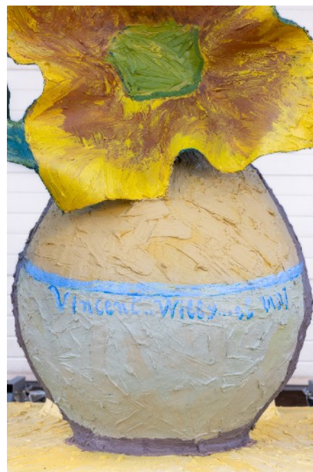
Vue sur le cerne marron qui accentue l'effet plat du vase en réalité rond

Le plasticien adopte le point de vue frontal de Van Gogh en travaillant le volume selon un angle de vue idéal pour le regardeur de 90°. Cet angle permet à la fois de respecter la vision proposée par le peintre et de constater de l'incidence lumineuse sur la touche en relief. Dans cet esprit, le vase – bien que réalisé en volume – a