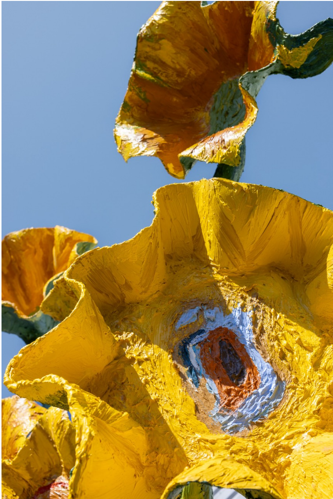
Septembre, sud est , 11h