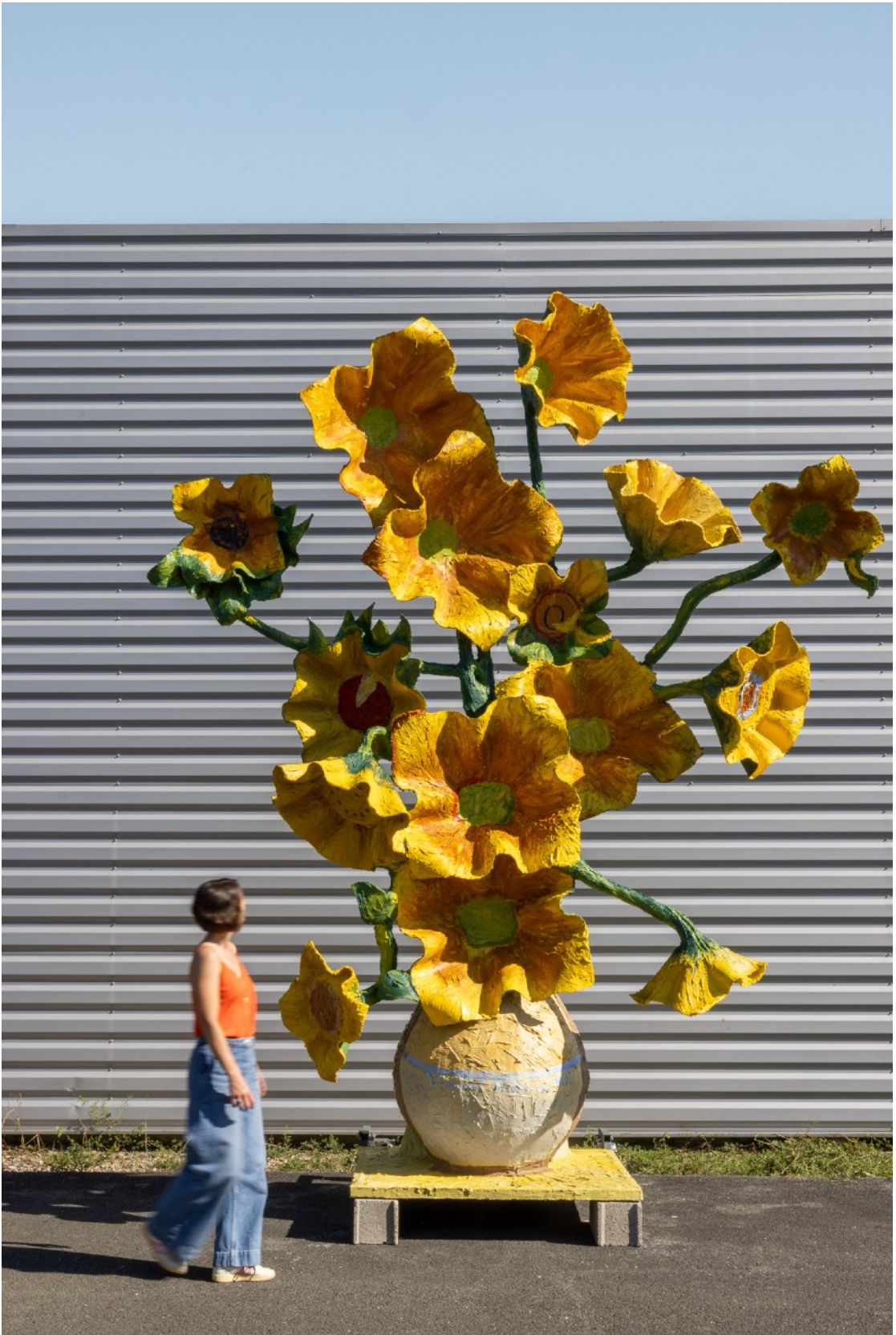
Septembre, sud ouest, 12 h