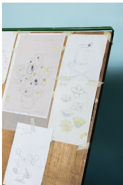
Aperçu de la table à dessins, croquis et dessins techniques

sculpture est plus qu'une forme en volume, elle est l'illustration qu'une sculpture peut devenir peinture par un traitement pictural puisé dans cette pratique, mais réalisé à l'aide de techniques et matériaux issus de l'industrie.