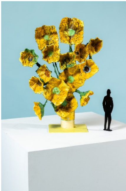
Maquette de l'œuvre, 68 x 50 x 20 cm

des jardinières, la touche épaisse de l'artiste en référence à celle de Van Gogh et la gamme chromatique. Le plasticien est convaincu de l'aspect visuel obtenu.