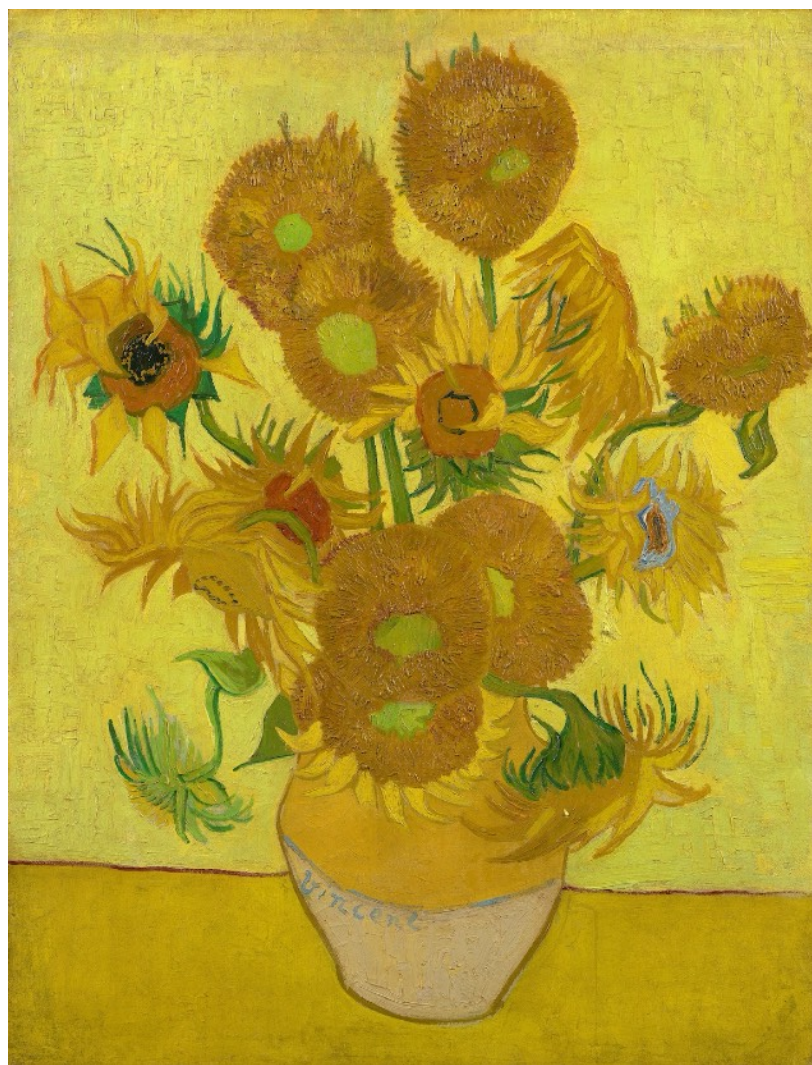
« Les tournesols », huile sur toile, 95 x 73 cm, 1889, Vincent Van Gogh