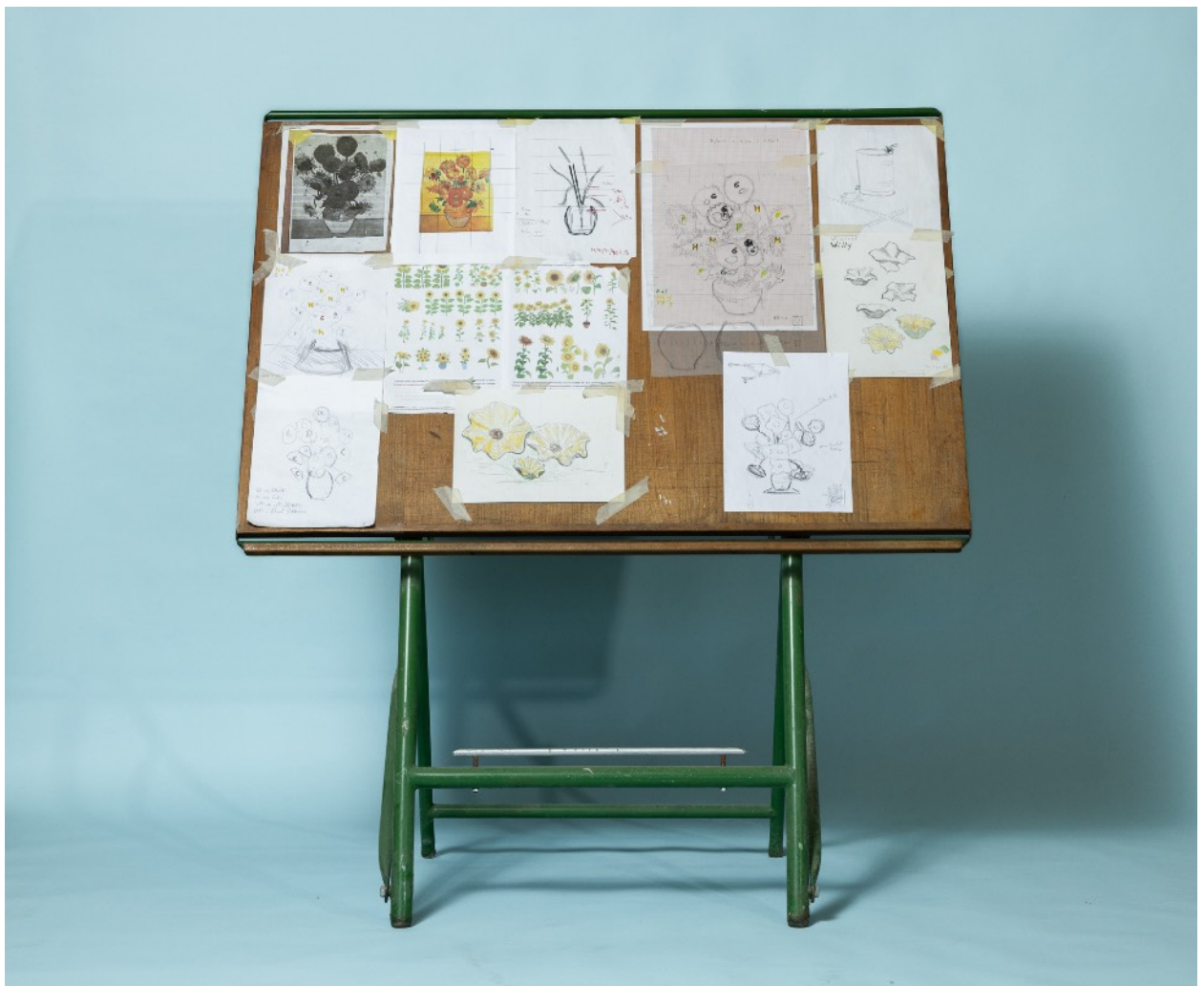
Table de recherche, esquisses et dessins techniques

« J'ai pensé cette pièce, je l'ai dessinée, je l'ai construite, à tout moment l'artiste a côtoyé l'artisan. L'artiste réfléchit, il pense, il dessine, il sculpte des petites jardinières qu'il passe à l'artisan pour les mouler ; l'artisan les assemble sous l'œil de l'artiste et ce dernier les peint. C'est l'artiste qui valide la maquette. »